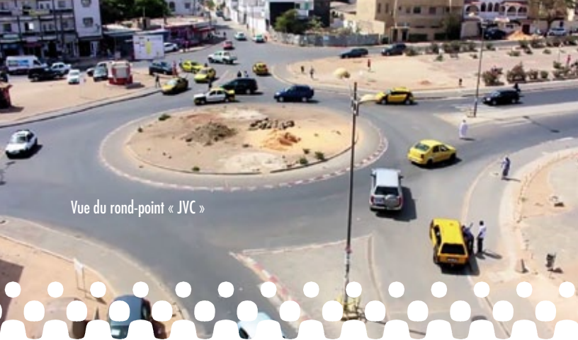
Vue du rond-point « JVC »

On l'aura compris, en prenant ces différentes mesures, le MITTD cherche à moyen terme à renforcer l'adéquation entre l'offre de transport et la demande de déplacements en agissant sur différents leviers qui portent notamment sur l'infrastructure, les services, les comportements des usagers et, de manière plus générale, l'organisation du secteur des transports urbains.