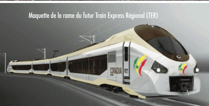
Maquette de la rame du futur Train Express Régional (TER)