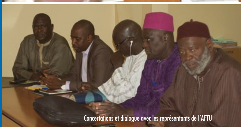
Concertations et dialogue avec les représentants de l'AFTU