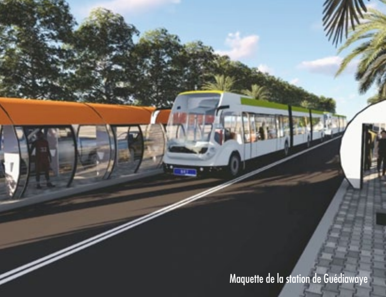
Maquette de la station de Guédiawaye