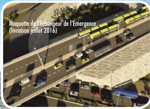
Maquette de l'Echangeur de l'Emergence (livraison juillet 2016)