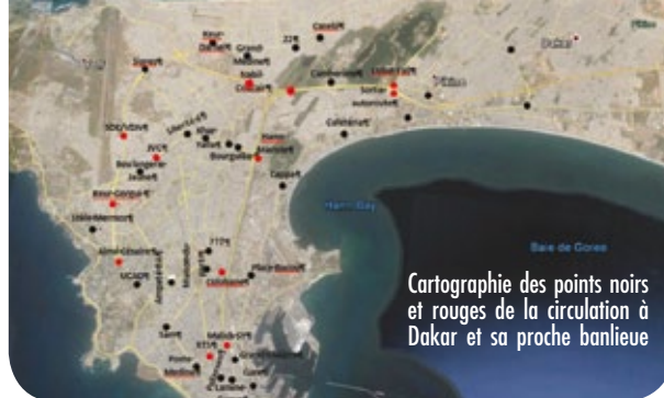
Cartographie des points noirs et rouges de la circulation à Dakar et sa proche banlieue

Les chiffres parlent d'eux-mêmes. Plus de 500 personnes perdent la vie chaque année au Sénégal dans des accidents de la route. Quand on sait que 90% des accidents de la circulation sont d'origine humaine, ces vies auraient pu être épargnées. En plus du comportement humain au volant, principale cause d'accidents, peuvent s'ajouter l'état du véhicule (5%) et celui de la route (5%). C'est fort de ce constat que le Chef de l'Etat, M. Macky Sall a appelé de ses vœux la mise en œuvre de réformes en profondeur pour la réduction des accidents de la route. C'est ainsi que pour répondre à cette volonté et dans le cadre d'une politique de sécurité routière visant la réduction des accidents de la route, le MITTD déploie d'importants efforts pour la sécurisation et la numérisation des titres de transport, l'extension de l'activité de contrôle technique moderne des véhicules automobiles sur tout le territoire national. S'y ajoute la mise en place d'un guichet unique automobile pour le processus de dédouanement et d'immatriculation des véhicules importés d'occasion. La mise en œuvre de cette politique aura inmanquablement un impact positif sur la mobilité dans les transports.