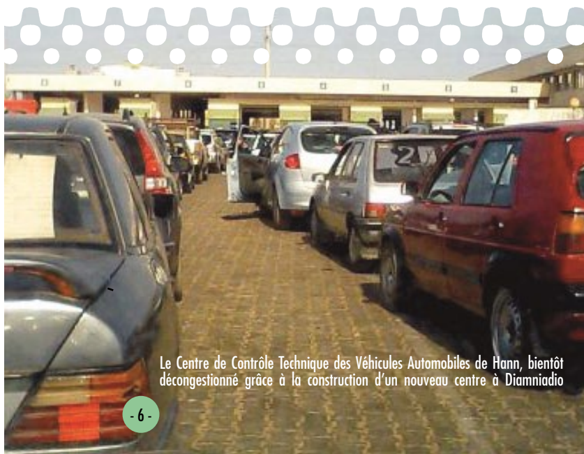
Le Centre de Contrôle Technique des Véhicules Automobiles de Hann, bientôt décongestionné grâce à la construction d'un nouveau centre à Diamniadio