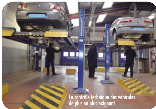
Le contrôle technique des véhicules de plus en plus exigeant