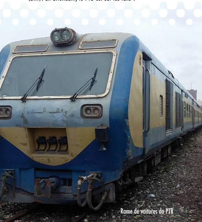
Rame de voitures du PTB

Premier train bi-mode (fonctionnant à l'électricité et au gasoil) en Afrique de l'Ouest, doté d'un système à double voie à écartement standard, le TER sera capable de circuler à 160 km/heure. Il desservira quatorze gares toutes neuves (dont celle du Pôle Urbain de Diamniadio) ou rénovées entre Dakar et le nouvel Aéroport International Blaise Diagne de Diass pour un trafic à terme de 115 000 voyageurs par jour. Ce projet ferroviaire qui verra le jour dans un peu plus de 2 ans constitue une véritable opportunité pour l'expansion et l'amélioration de la qualité de services qui étaient aujourd'hui limitées par la dégradation très avancée des voies et la vétusté des gares. Les habitants de la banlieue pourront bientôt profiter de cet important projet structurant de l'Etat qui jouera un rôle majeur dans l'amélioration de la mobilité dans un environnement modernisé et parfaitement intégré y compris au projet de Bus Rapid Transit (BRT). En attendant, le PTB est sur les rails !