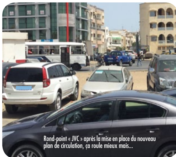
Rond-point « JVC » après la mise en place du nouveau plan de circulation, ça roule mieux mais...

Autre mesure. Ceux qui sont passés du côté des Sicap Liberté 5 et 6 l'auront remarqué. Un nouveau plan de circulation vient d'être mis en place entre le rond-point « Boulangerie Jaune » et le rond point « JVC » (voir encadré ci-contre). D'autres modifications des plans de circulation, visant à rendre plus fluide le trafic et à réduire les accidents au niveau de points stratégiques de l'agglomération dakaroise, vont bientôt suivre. Sur le plan des aménagements, des initiatives concrètes sont aussi menées telles que la modification prévue de carrefours, l'amélioration de la régulation grâce à l'installation de feux lumineux de signalisation ainsi que la généralisation et la mutualisation des points d'arrêts des transports collectifs.