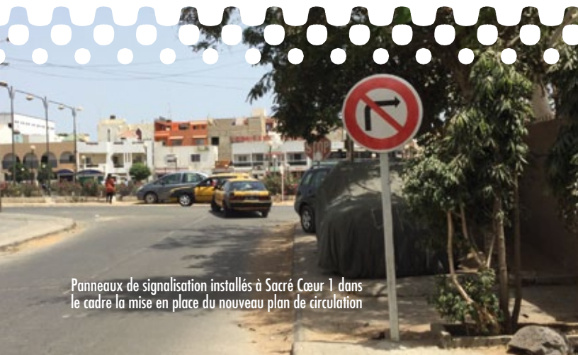
Panneaux de signalisation installés à Sacré Cœur 1 dans le cadre la mise en place du nouveau plan de circulation

On l'aura compris, en prenant ces différentes mesures, le MITTD cherche à moyen terme à renforcer l'adéquation entre l'offre de transport et la demande de déplacements en agissant sur différents leviers qui portent notamment sur l'infrastructure, les services, les comportements des usagers et, de manière plus générale, l'organisation du secteur des transports urbains.