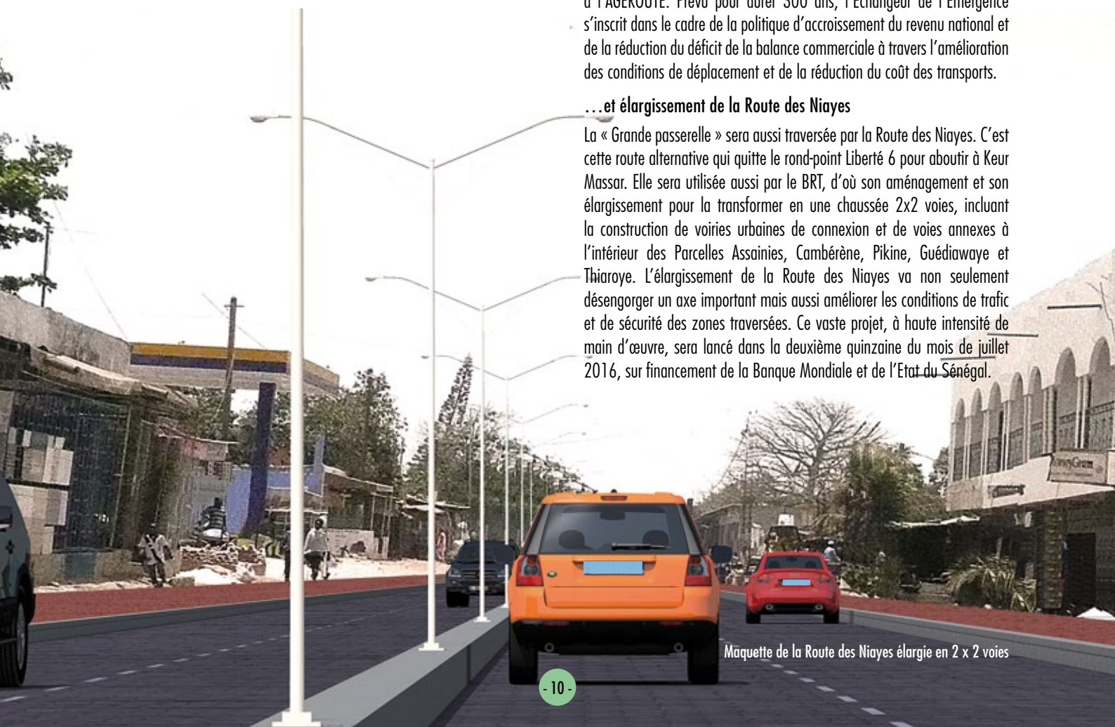
Maquette de la Route des Niayes élargie en 2 x 2 voies

La « Grande passerelle » sera aussi traversée par la Route des Niayes. C'est cette route alternative qui quitte le rond-point Liberté 6 pour aboutir à Keur Massar. Elle sera utilisée aussi par le BRT, d'où son aménagement et son élargissement pour la transformer en une chaussée 2x2 voies, incluant la construction de voiries urbaines de connexion et de voies annexes à l'intérieur des Parcelles Assainies, Cambérène, Pikine, Guédiawaye et Thiaroye. L'élargissement de la Route des Niayes va non seulement désengorger un axe important mais aussi améliorer les conditions de trafic et de sécurité des zones traversées. Ce vaste projet, à haute intensité de main d'œuvre, sera lancé dans la deuxième quinzaine du mois de juillet 2016, sur financement de la Banque Mondiale et de l'Etat du Sénégal.