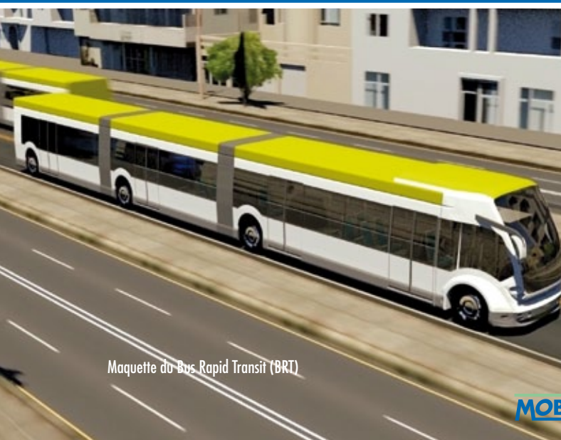
Maquette du Bus Rapid Transit (BRT)